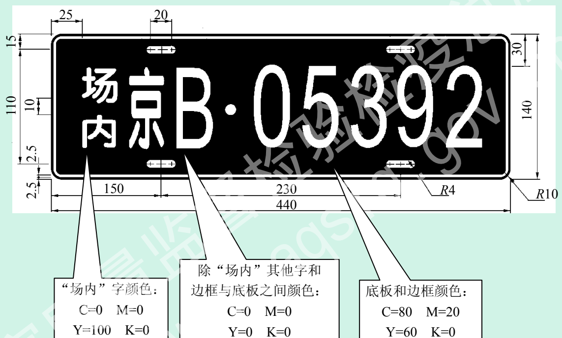
图 H 场(厂)内专用机动车辆车牌式样